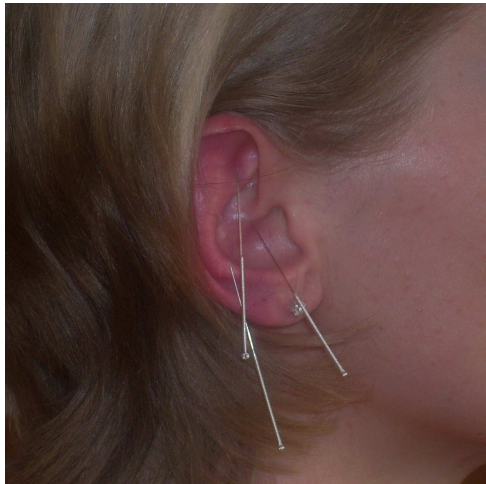
Ohrakupunktur bei HWS-Syndrom.